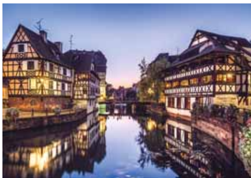
Grande Île / Maison des Tanneurs

Treffpunkt: Lobby des Tagungshotels Sofitel • Kostenbeitrag: 35,00 € p. P. zzgl. USt. (inkl. Eintritt und Führung durch das Münster)