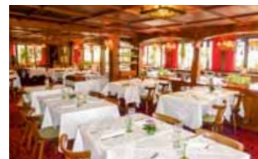
Highlight: Brasserie Les Haras