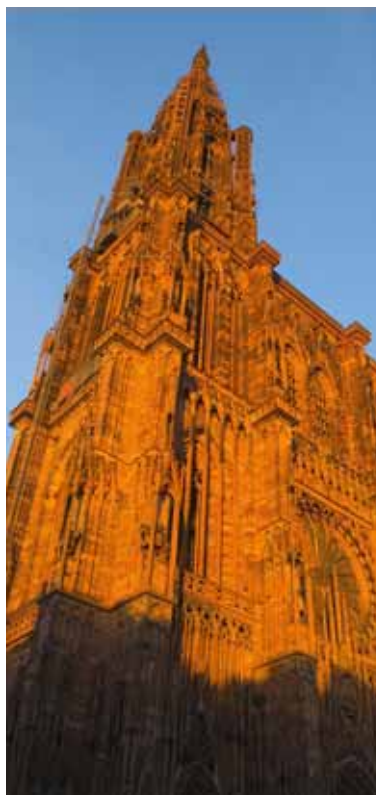
Liebfrauenmünster zu Straßburg