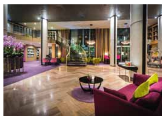
Sofitel Strasbourg Grande Île