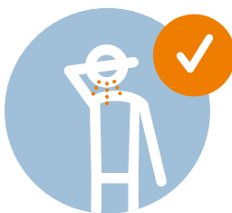
Nies- und Hustenetikette bewahren