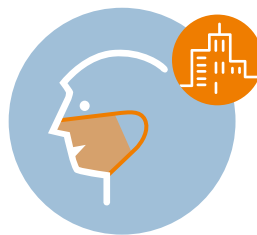
Mund-Nasen-Schutz auf allen öffentlichen Flächen