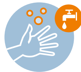
Händehygiene einhalten – Reinigungsmöglichkeiten werden bereitgestellt